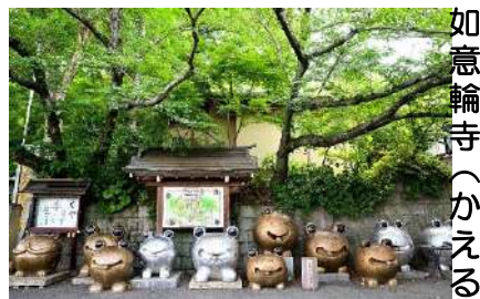
如意輪寺（かえる寺）