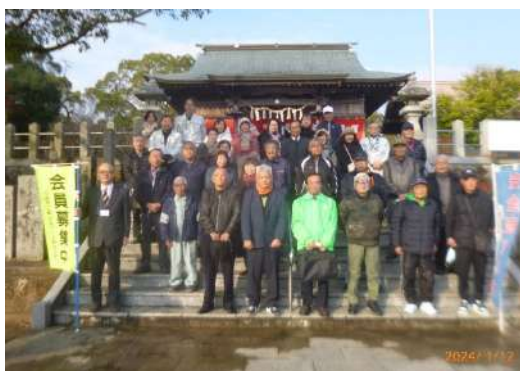
安全祈願祭（1月12日） ～小笠原神社～